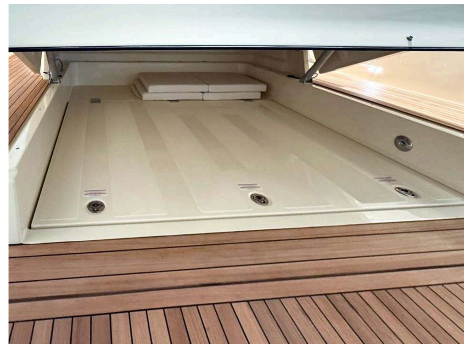
Opening stern sundeck