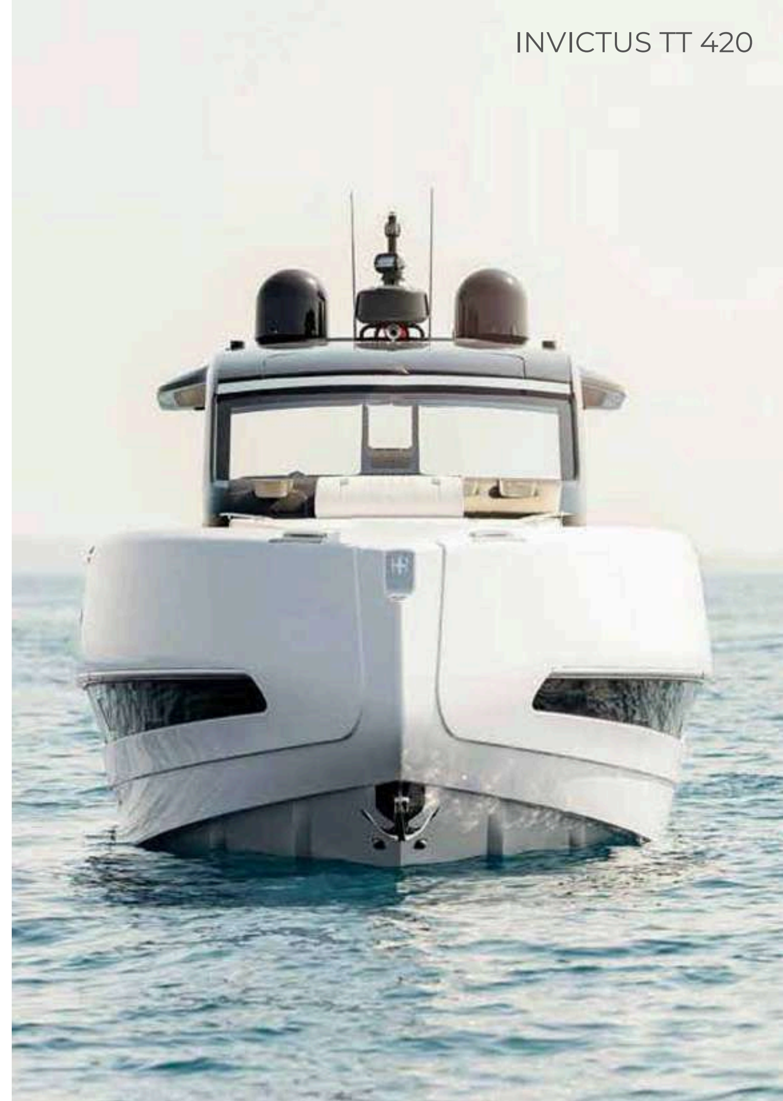
INVICTUS TT 420