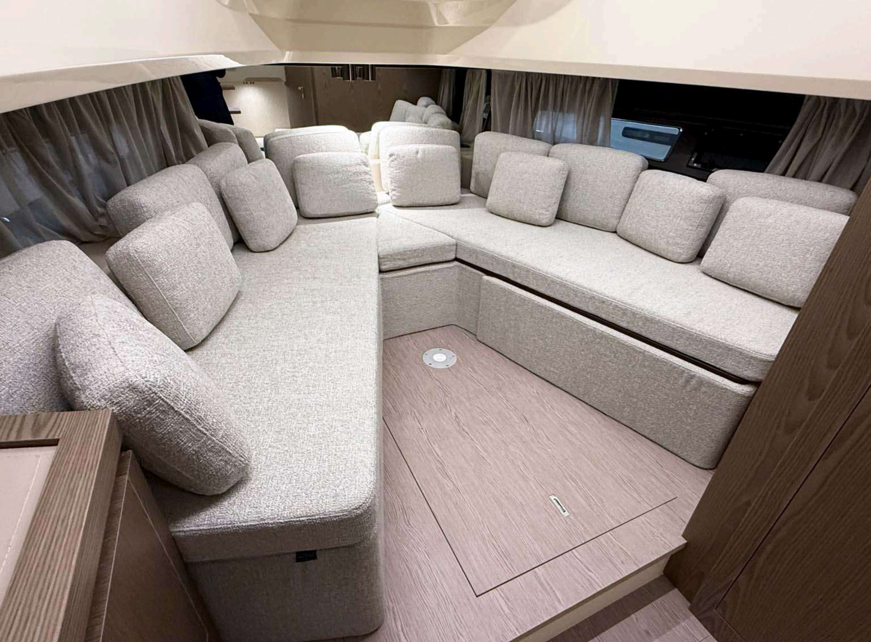
Lower deck converted cabin