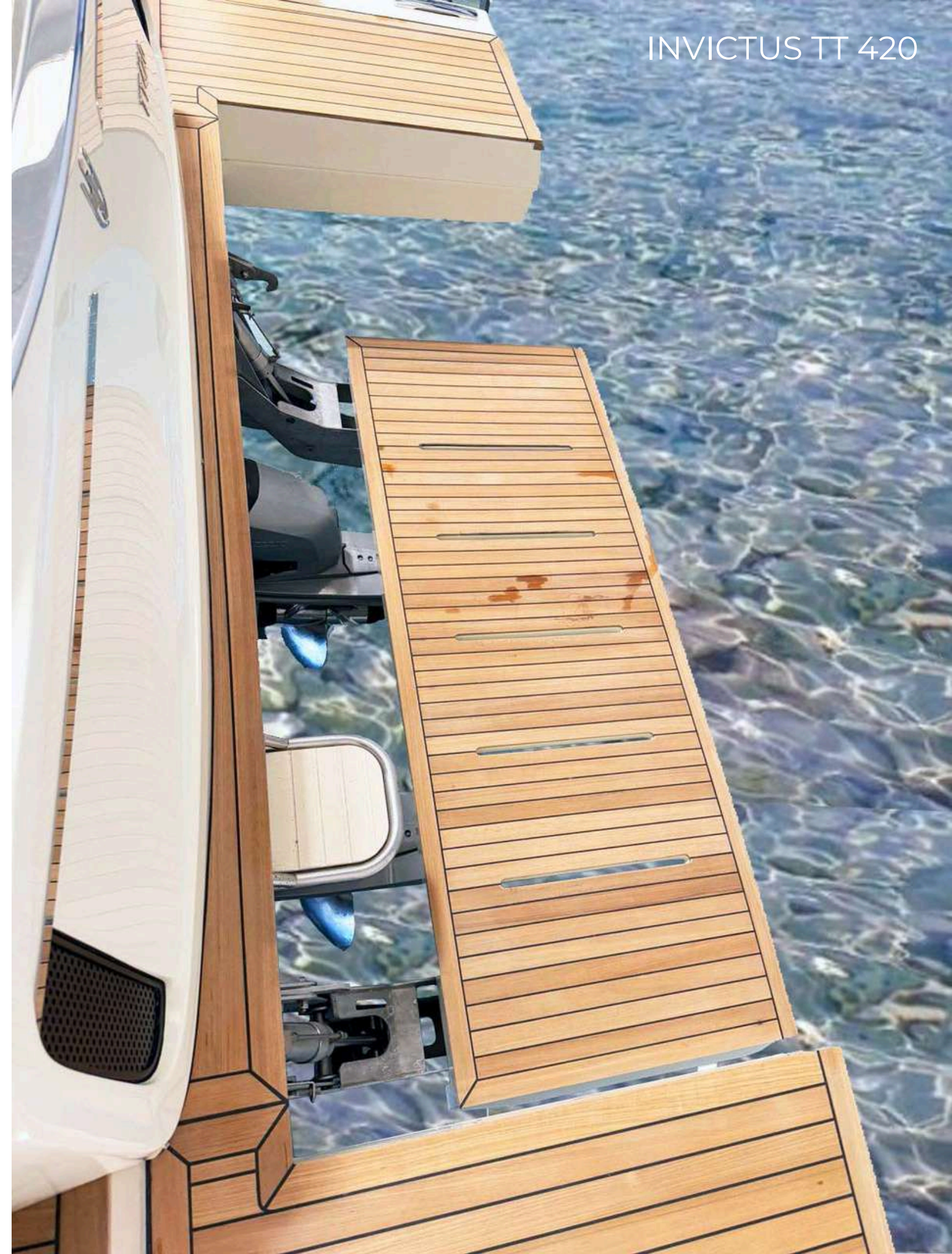
INVICTUS TT 420