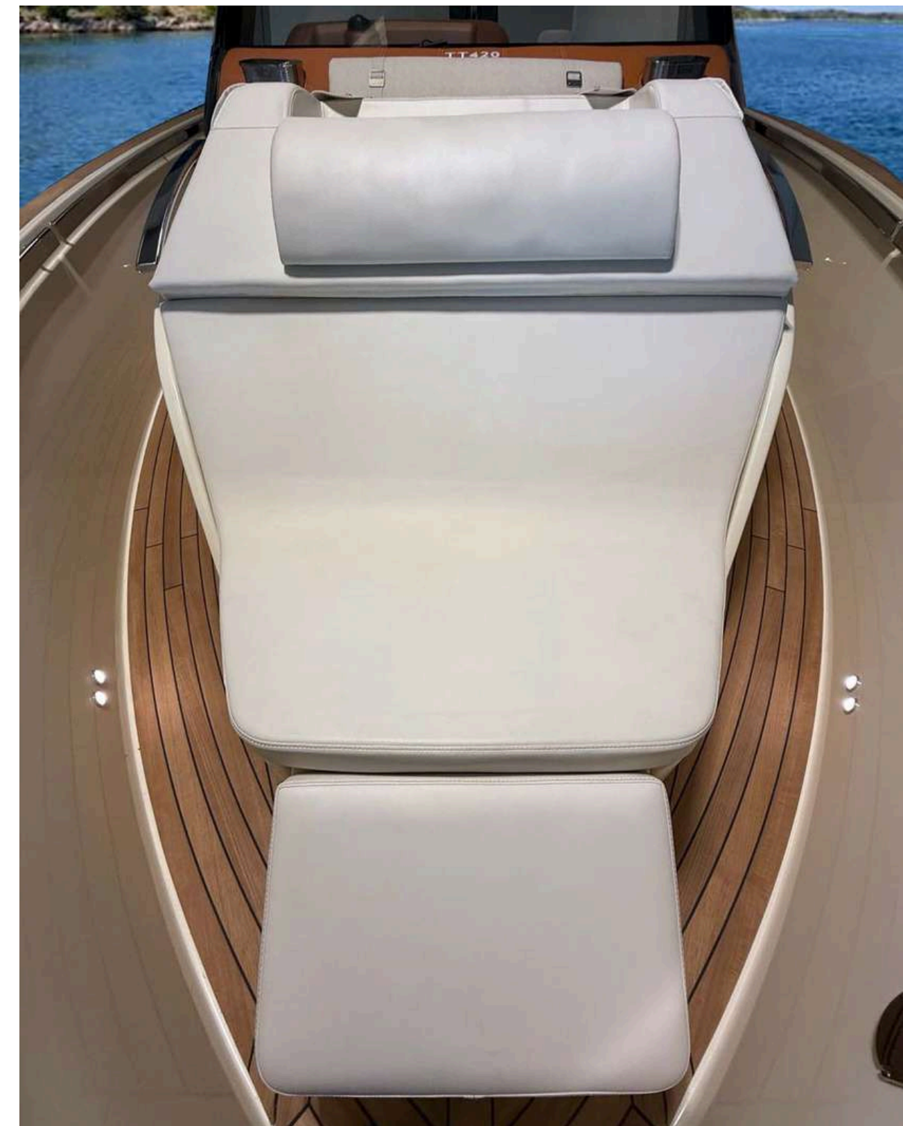
Adjustable bow sunshade