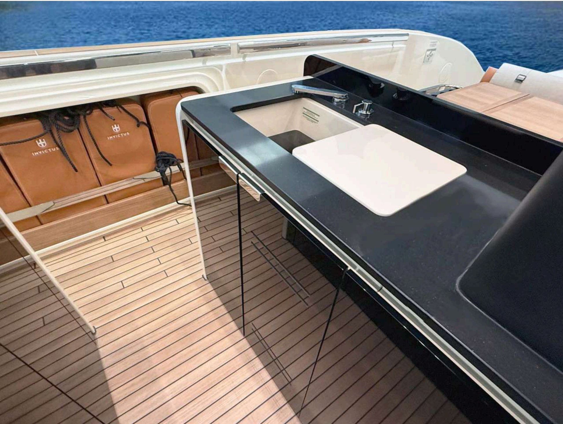
Main deck furniture