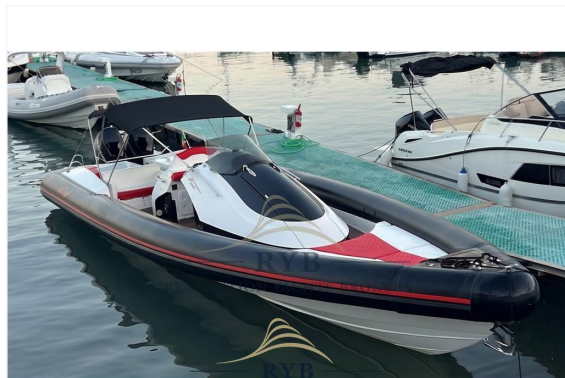
REVOLUTION YACHTS BROKERS