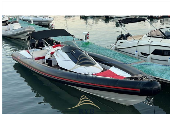
REVOLUTION YACHTS BROKERS